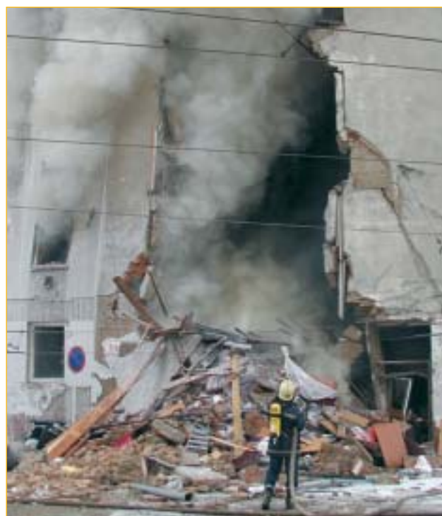
Výbuch plynu v Brně na ulici Tržní.

Jak se účinně chránit proti přítomnosti nebezpečných plynů