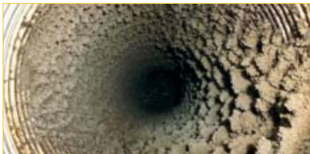
Zanesená komínová vložka pro spotřebič na zemní plyn.

Tato povinnost se dle současně platných právních předpisů netýká občanů (fyzických osob). Tyto osoby jsou povinny instalovat tato zařízení v souladu s pravidly pro užívání a technickými návody pro instalaci. Dále jsou povinny udržovat plynová zařízení v takovém stavu, aby nedošlo k ohrožení života, zdraví či majetku a v případě zjištění závady tuto neprodleně odstranit.