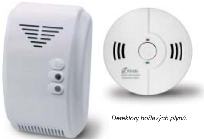
Detektory hořlavých plynů.